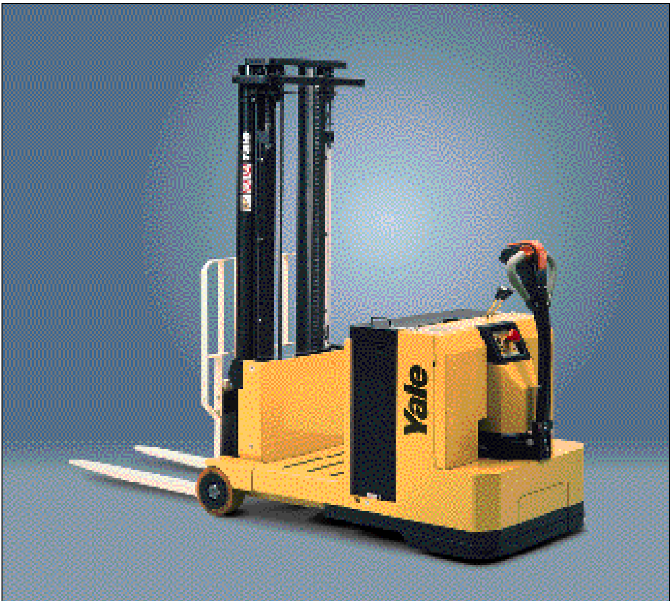
Der abgebildete Stapler enthält Sonderausstattungen